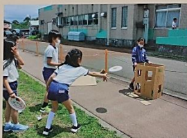
3年生「アクティブファン」