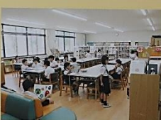
ゆったり過ごすことができる図書館