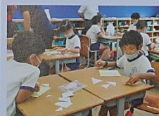
2年生・実践算数科