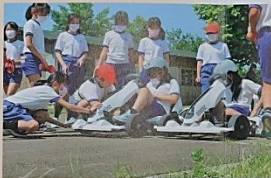
5年生「クルマテクノロジー」