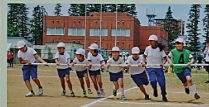
ポプラオリンピック