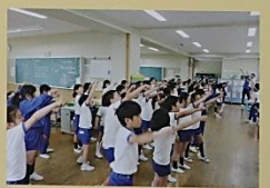
オープンスペースのある広い教室