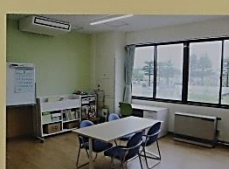
通級指導教室(ポプラルーム)