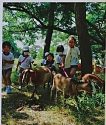
1年生「はなやぎまきは」

各学級の年間を貫くテーマを基に、体験を積み重ねることを大切にして、生活を豊かにしたり、身の回りの環境をつくり変えたりしながら、実生活に生きる知を身に付け、自分の生きる世界をひろげていきます。