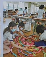
4年生・実践図画工作科