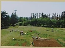
のびのび活動できる広い敷地(原っぱ)