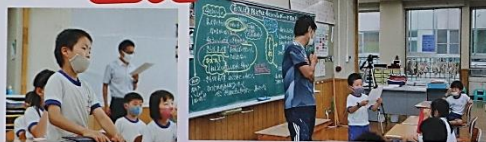
1年生「お散歩について」