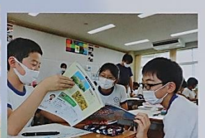
6年生・実践社会科