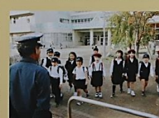
安全・安心を守る警備員