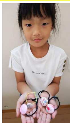
布とくるみボタンで作ったヘアゴム