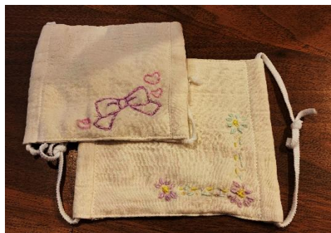
上越市からのマスクに刺繍をしました