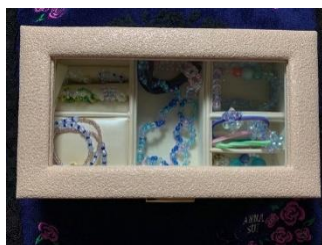
アイロンビーズ のコースター